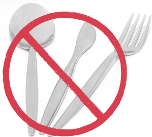
Plastik na kubyertos