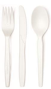
PLA na kubyertos

Simula Hulyo 1, 2022, kailangang gumamit at magbigay ng mga produktong serbisyo ng pagkain na puwedeng gawing compost ang mga negosyo ng serbisyo sa pagkain sa Burien.