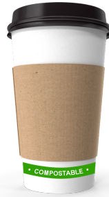
Papel na tasa na may saping PLA