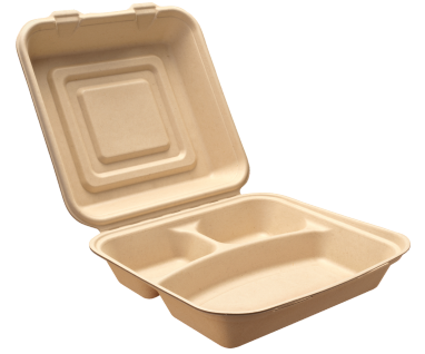
Fiber na lalagyan ng pagkain