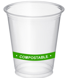
PLA na tasa