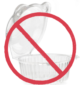
Plastik na lalagyan ng pagkain

Ang layunin ng ordinansang ito ay para ingatan ang kalusugan ng publiko, bawasan ang basura, at limitahan ang mga nakakapinsalang bagay na nakakarating sa kapaligiran.