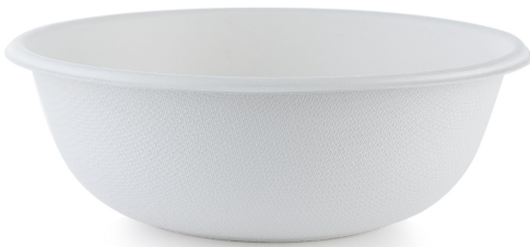
Papel na mangkok