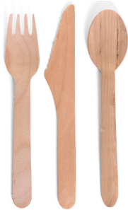
Đồ dùng bằng sợi